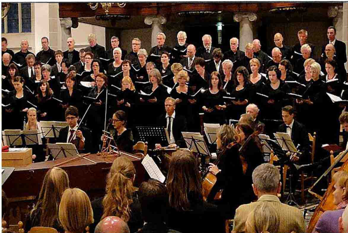
Een historisch moment. Zaterdagavond trad in de Grote Kerk van Steenwijk het Duitse Kammerchor Dillenburg gezamenlijk op met Cantica Sacra uit Steenwijk.

Haar ingrediënten waren om van te smullen: hapklare stukken van populaire klassieke componisten die bij een breed publiek lekker in het gehoor liggen. Veel werk van Händel, Bach, Mozart, maar ook de beroemde Eurovisie-tune. Laagdrempelig en toegankelijk voor